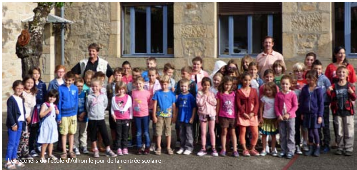
Les écoliers de l'école d'Ailhon le jour de la rentrée scolaire

Enfin mettant à profit l'adhésion de la commune au projet l'Hippocampe de piscine-supra communale d'Aubenas nos jeunes élèves ont pu bénéficier dès le début de l'année scolaire d'une initiation à la natation, acheminés pour ce faire avec une grande régularité par car et alors accompagnés de parents.