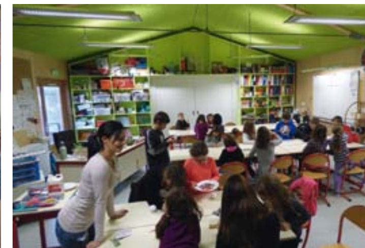
Dans la classe, en action et en pose, les enfants confectionnent des boules de Noël avec les deux ATSEM.