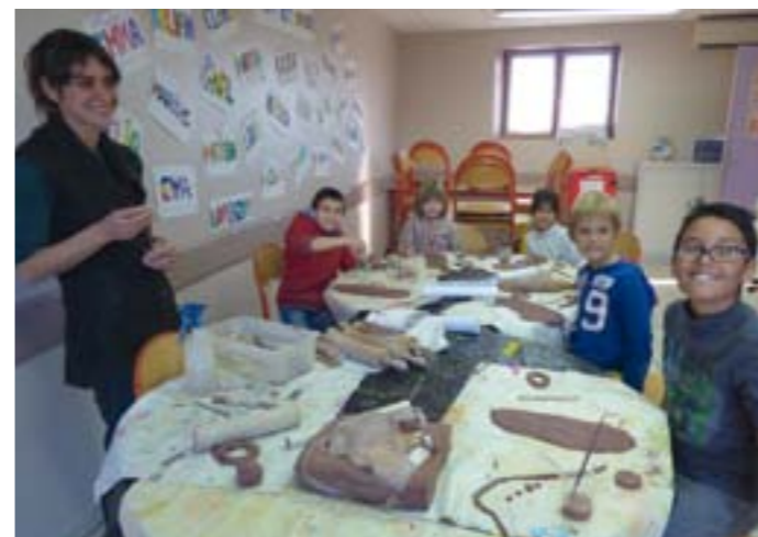
Dans la cantine, en action et en pose également, un petit groupe apprend la poterie avec l'animatrice. Les élèves viennent à tour de rôle pendant une heure. Ils fabriquent un bol avec la technique du boudin.